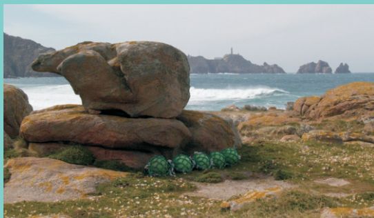
O oso, a máis coñecida das rochas con nome que se atopan na punta das Forcadas