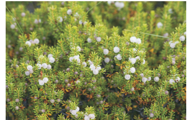
A camariña ( Corema album ) ten neste espazo a máis importante poboación de Galicia.