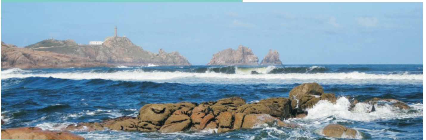
Cabo Vilán e o illote Vilán de Fóra desde a praia de Area Longa.