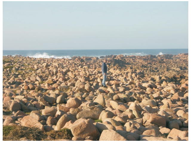
Coido na Punta do Boi.