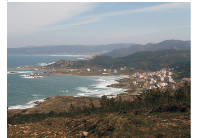
Arou desde o Alto da Cruz.