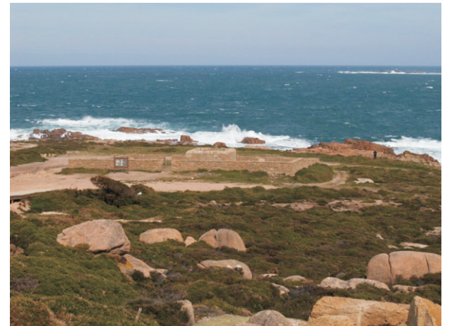
Cemiterio dos Ingleses. Onde foron soterrados os tripulantes do "Serpent", buque escola da mariña británica que naufragou nesta costa en 1890.