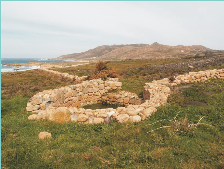
Foxo do Lobo. Atópase á dereita do camiño á altura da praia de Arealonga