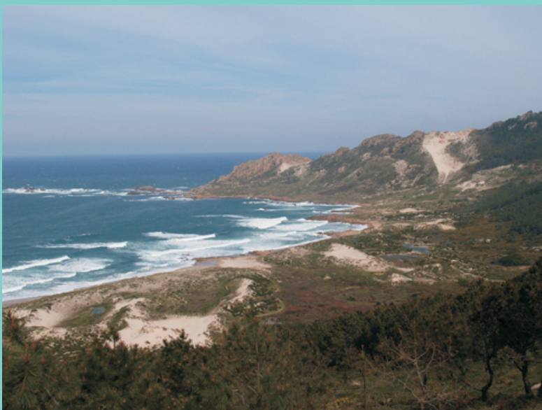
Praia do Trece, o lugar de maior interese polas formacións dunares e a importancia das plantas asociadas a elas.